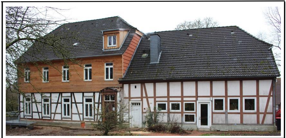
Pfarr- und Gemeindehaus